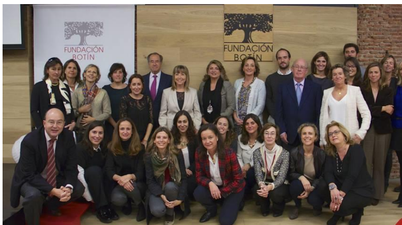
Fotografía de las entidades ganadoras